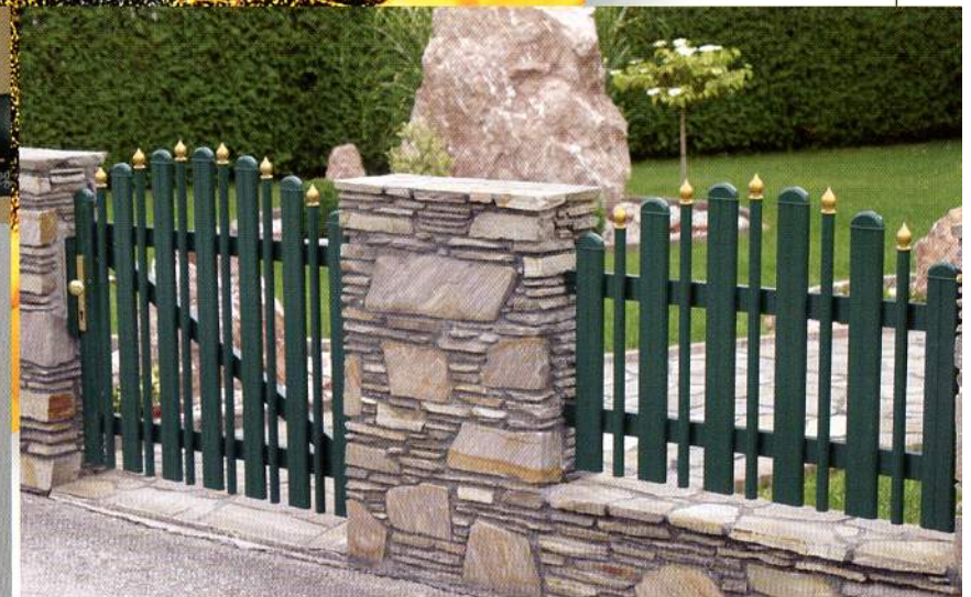
Bild 5-2504: Milano Zaunfeld und Gehüre, konvex rund, in RAL 6005, mit goldfarbenen Zwiebeln