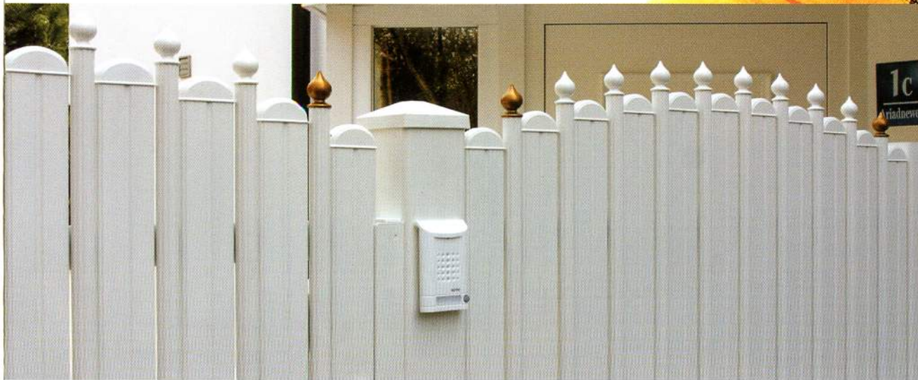
Bild 5-2501: Milano Zaunanlage mit engem Lattenabstand, konvex rund, in RAL 9010