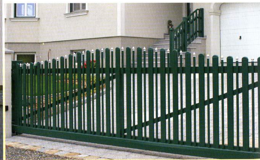
Bild 5-2403: Milano Schiebetor, konvex geschwungen, in RAL 6005, silberfarbene Zwiebeln