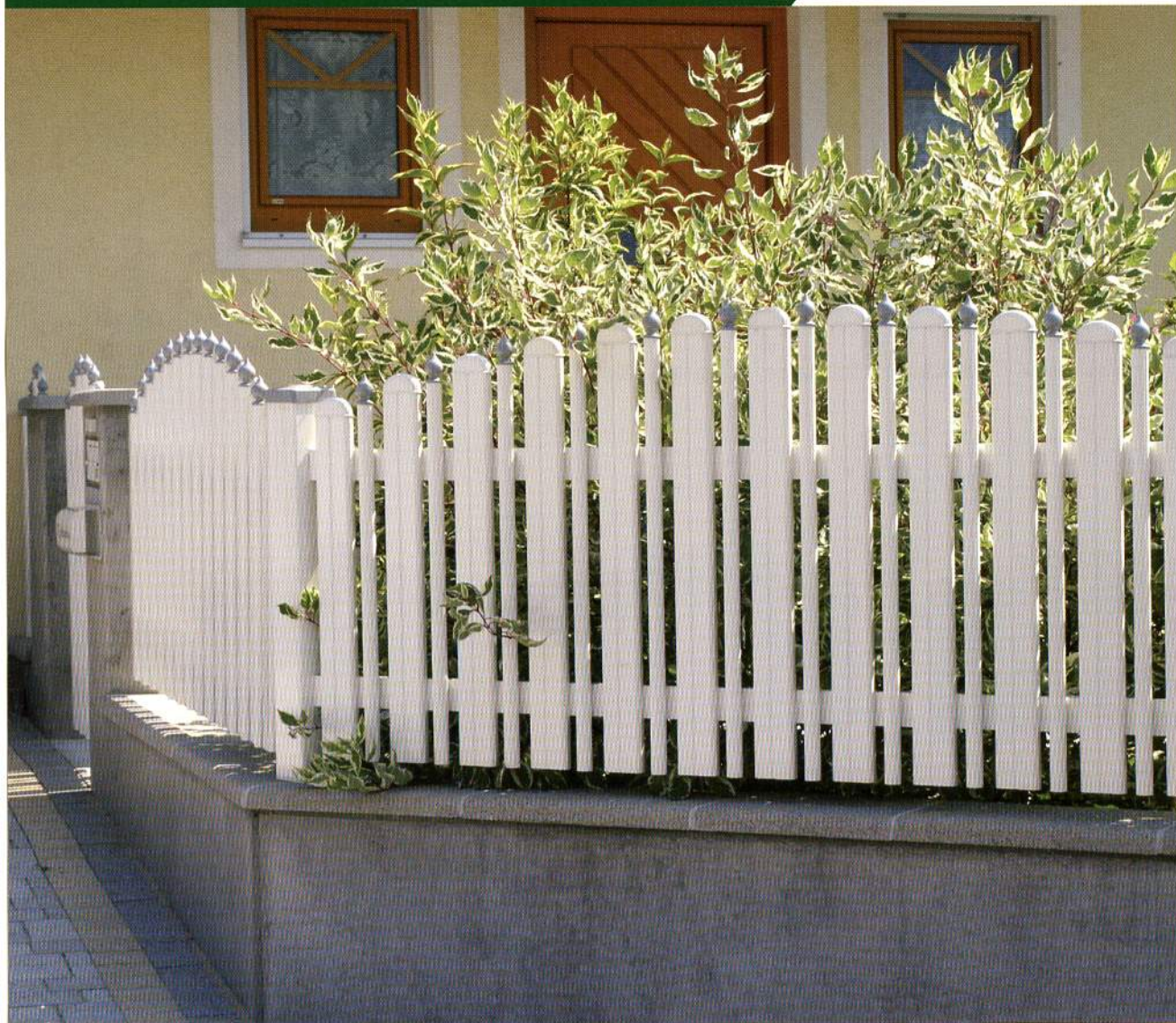
Bild 5-2401: Milano Zaunanlage, konvex rund, in RAL 9010, Zwiebeln in RAL Sonderfarbe