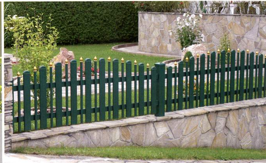
Bild 5-2402: Milano Zaunanlage, konvex rund, in RAL 6005, goldfarbene Zwiebeln